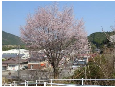
②板屋ゲートボール場 青空をバックに見事な姿が見られる。いろいろな紹介に使われている紀和を代表するクマノザクラ