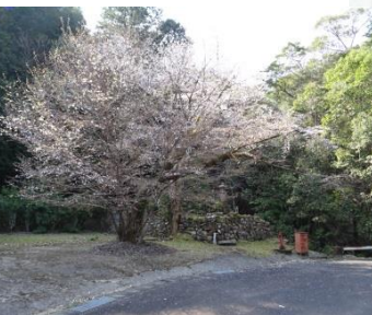
⑤楊枝観音(円通寺跡) 地元の人のていねいな管理もあって、太く朽ちた幹が歴史を物語る老齢木