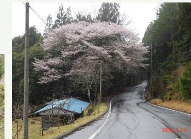
⑦田平子刑場跡近く 紀和で最大で、開花の期間が長いクマノザクラ