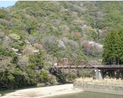
①小川口ジェット船乗降場 北山川と鉄橋に色とりどりクマノザクラが映えるビュースポットです。ツエノ峰の斜面にクマノザクラが多数見えます