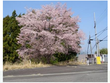
③長尾の西山電話局前 紀伊半島随一ともいえるクマノザクラ。濃紅色で紀和町の宝

103年ぶりに新発見された野生種のサクラ クマノザクラ Cerasus kumanoensis