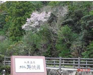
④瀬流荘前 トロッコ列車との撮影ポイント