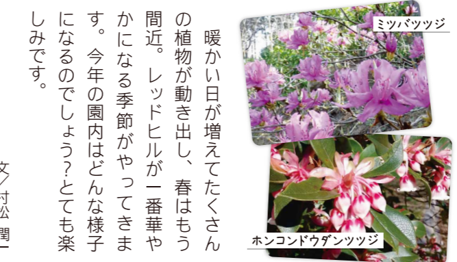
ミツバツツジ ホンコンドウダナンツツジ

よいもの、逆に良くないものもあり、毎年咲いたり咲かなかったりと意外と個性があつて、スイセンのイメージが変わるかも。 3月中旬頃から4月中旬頃までの約ひと月の期間、花を楽しませてくれます。