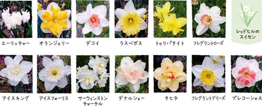
エーリッチャー オランジェリー デコイ ラスベガス トゥリパタイト フレグラントローズ レッドヒルのスイセン アイスキング アイスフォーリス サウインストンチャーチル デナルショー タヒチ フレグラントブリーズ プレコーシャス

よいもの、逆に良くないものもあり、毎年咲いたり咲かなかったりと意外と個性があつて、スイセンのイメージが変わるかも。 3月中旬頃から4月中旬頃までの約ひと月の期間、花を楽しませてくれます。