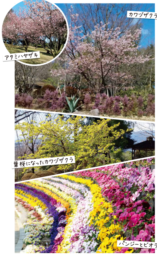
アタミハヤザキ カワヅザクラ 葉桜になったカワヅザクラ パンジーとビオラ

バラの売り場でまず目立つのがやはり「赤」、次に品種数が圧倒的に多い「ピンク」。そんな中で、つい選びたくなるのが黄色系のようです。 黄色系は弱い品種が多いですが、この品種は耐病性最強レベルです。しかもトゲが少なく、また、花がらつみをしなくても次々に咲いてくれるのも嬉しい特長です。