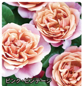
ピンク・ペンテージ

シックな赤紫で高芯くロゼット咲きの整った花です。大輪花で香りも強いので、これだけでも人気が出そうです。さらに、新芽が艶のある赤紫色で、春や秋の芽吹き時期には花がなくてもガーデンの中で目立つ存在になれるそうです。トゲが少なく、大きくなりにくいのでビギナーにもオススメです。