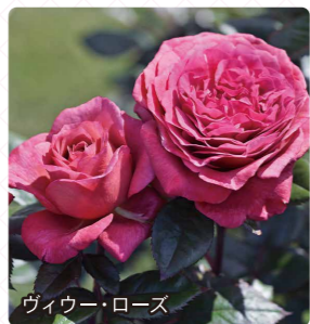
ヴィウー・ローズ

シックな赤紫で高芯くロゼット咲きの整った花です。大輪花で香りも強いので、これだけでも人気が出そうです。さらに、新芽が艶のある赤紫色で、春や秋の芽吹き時期には花がなくてもガーデンの中で目立つ存在になれるそうです。トゲが少なく、大きくなりにくいのでビギナーにもオススメです。